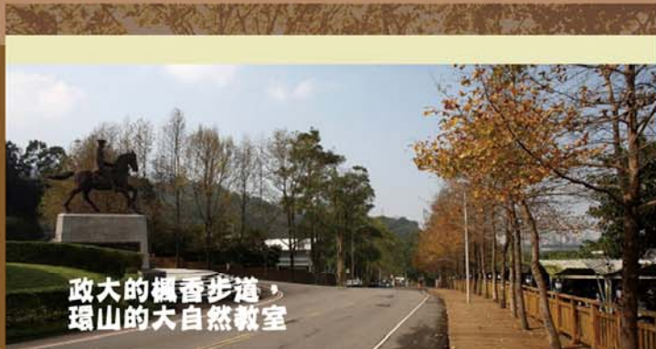
政大的楓香步道，環山的大自然教室

繼續往前，本校第一任校長蔣中正先生的騎馬雕像守護著自強宿舍，許多傳奇故事也在此口耳相傳，為政大校園增添幾分想像空間。據說蔣校長英勇威嚴的形象，對校園的寧靜和安全的維護，也具有相當程度的貢獻。跟著蔣校長前進的方向走過二百公尺的下坡路，就會到達政大後山校門，也是楓香步道的終點，外面就是木柵老泉里，從恆光橋也能通往木柵市區。