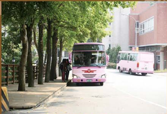
經過藝文平台，連結自強宿舍

從藝文崗哨往後校門走，首先來到一座木平台，座落於榕樹樹蔭底下，簡單的幾張椅子，留給使用者更大的想像空間，打打太極拳、外丹功，甚至於席地而坐，閉上雙眼冥想…許多人在這裏找到釋放心靈的方法。木平台之後，經過一小段斜坡，視野非常開闊，每年101大樓新年施放煙火，總是吸引大批人潮在此佇足觀賞。從這裏橫跨馬路，爬上「好漢坡」便是自強宿舍。