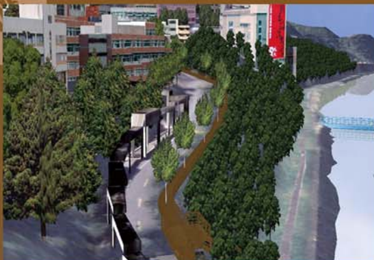
政大楓香步道，連結山上、山下校園

政大楓香步道自渡賢橋至後山校門，全長約1公里，是連結山下和山上校園的重要人行動線。楓香步道是從既有的人車共用道路系統中獨立出來，利用路旁的「楓香」行道樹的樹冠底下，以鋪設棧道方式將步道建置而成，在不妨礙行道樹生育的前題下，創造行人所需的通行空間，步行其間，不僅免除烈日曝曬的不適，更可避開車輛碰撞的威脅，校園安全更有保障。本項工程於96年12月完工，採用鋼骨構造及南方松原木材料，以人工挖掘方式埋設水泥基礎，沿著環山一道楓香行道樹建築而成。由於採用了生態工法建造，原木鋪面架設在地面上，不但保留原有土壤表面的透水性，對邊坡的擾動